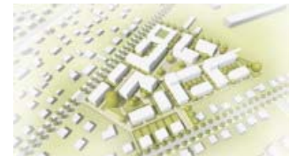
3. Platz: Baufrösche Architekten und Planer (Kassel, Köln, Berlin)