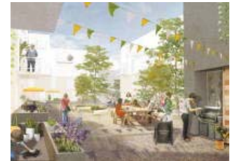
1. Platz: die Baupiloten (Berlin)