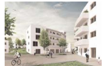
2. Platz: Kaden + Lager (Berlin)