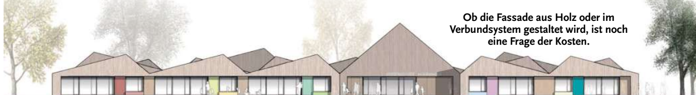
Ob die Fassade aus Holz oder im Verbundsystem gestaltet wird, ist noch eine Frage der Kosten.

ben.“ Strittig ist auch, ob der zukünftige „Anlieferverkehr der Eltern“ (Hettwer) auf dem Ernst-Hugo-Weg problemlos an- und abfahren kann. Vor allem treibt die Krähenwinkler die Sorge um, es könnten viele unerlaubt von Norden über den dort gesperrten Ernst-Hugo-Weg kommen.